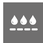
RESISTENTE AL AGUA