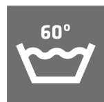
LAVABLE A 60°