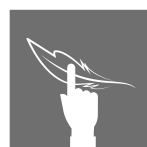
TACTO EXTRA SUAVE