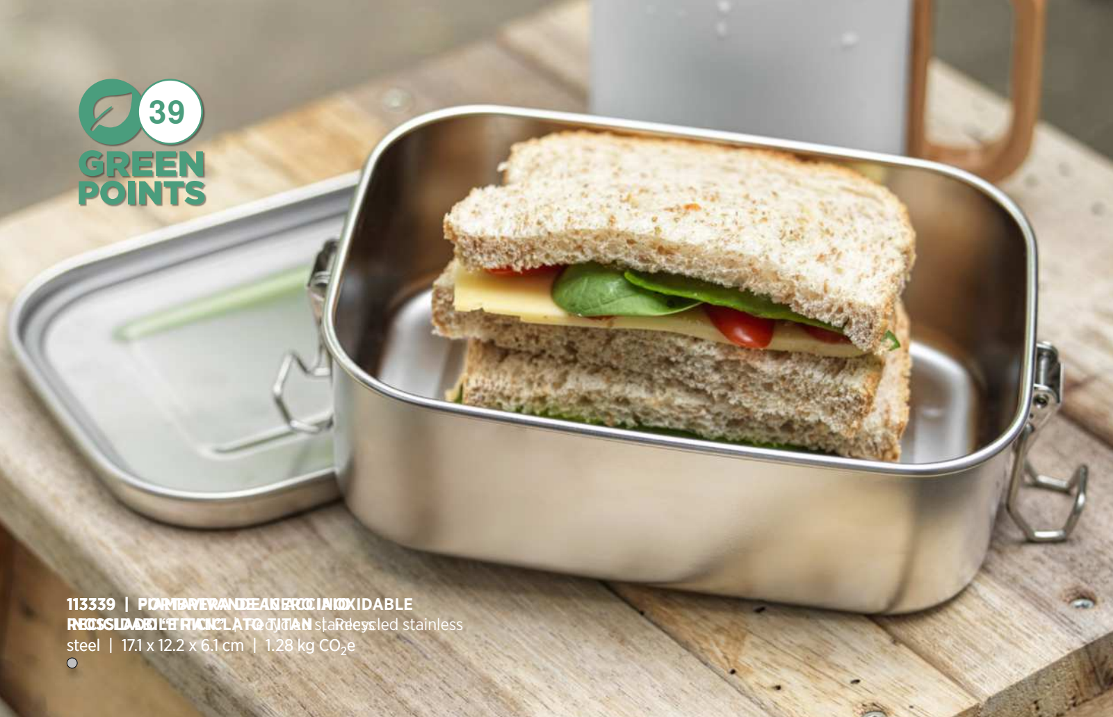
113339 | FIAMBRERA IN ACCIAIO INOXIDABILE RICICLATA 100% | 100% Recycled stainless steel | 17.1 x 12.2 x 6.1 cm | 1.28 kg CO 2 e