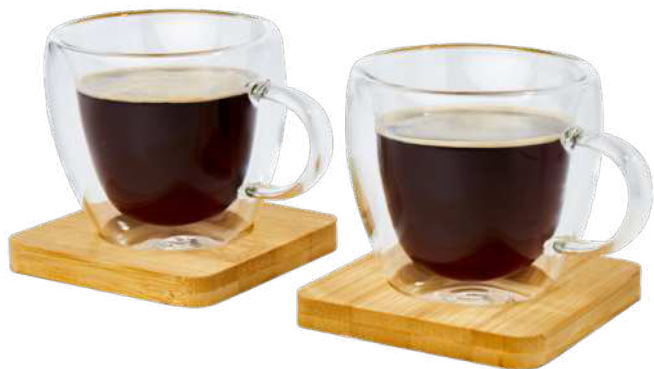
113314 | DOS TAZAS DE VIDRIO DE DOBLE PARED DE 100 ML CON POSAVASOS DE BAMBÚ "MANTI" | Vidrio borosilicato | 9.5 x 7.4 x 7 cm | 0.635 kg CO 2 e