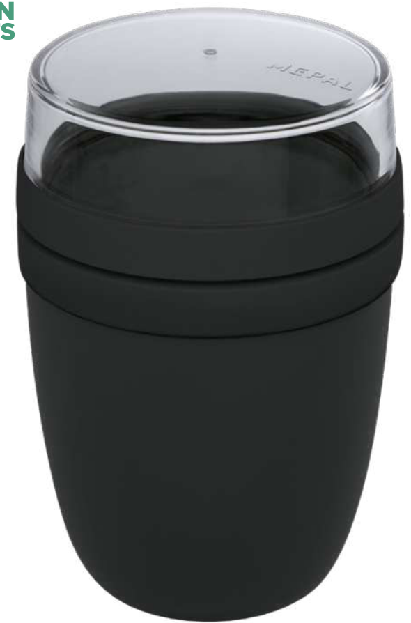
113133 | MEPAL FIAMBRERA "ELLIPSE" | Plástico PP | Ø 10 x 15 cm | 1.193 kg CO 2 e ○●●●