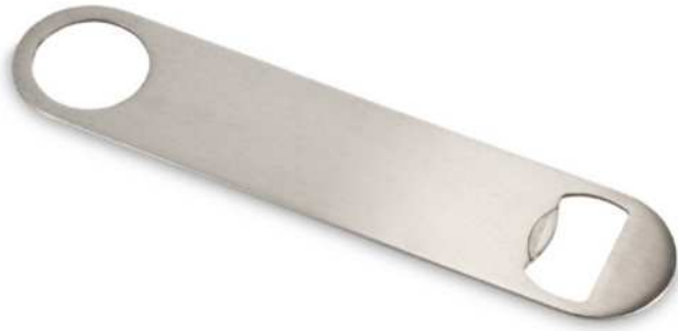
112902 | ABREBOTELLAS "PADDLE" | Acero inoxidable | 18 x 4 cm | 0.705 kg CO 2 e