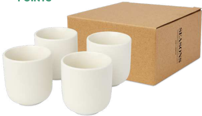
113317 | CUATRO TAZAS DE EXPRESO DE 90 ML "MALE" | Cerámica | Ø 5.8 x 6.2 cm | 0.876 kg CO 2 e