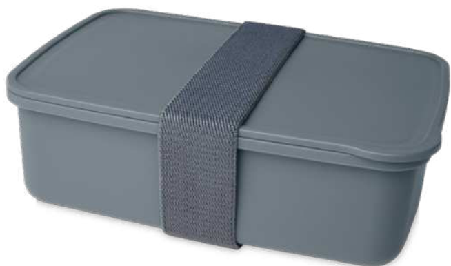
113274 | FIAMBRERA IN PLASTICA RICICLATA 100% | 100% Recycled plastic | 19 x 13 x 6 cm | 0.579 kg CO 2 e