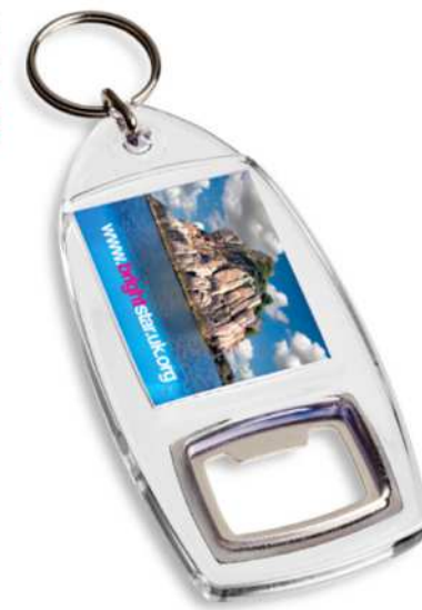
210550 | LLAVERO ABREBOTELLAS R1 "JIBE" | Plástico GPPS | 9.7 x 4.7 x 0.6 cm | 0.124 kg CO 2 e