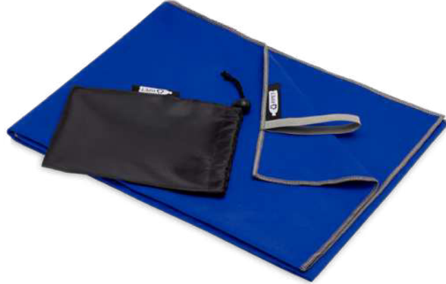
113323 | TOALLA ULTRALIGERA Y DE SECADO RÁPIDO GRS DE 50 x 100 CM "PIETER" | Poliéster reciclado - Nylon | 100 x 50 cm | 0.176251 kg CO 2 e ●●●●