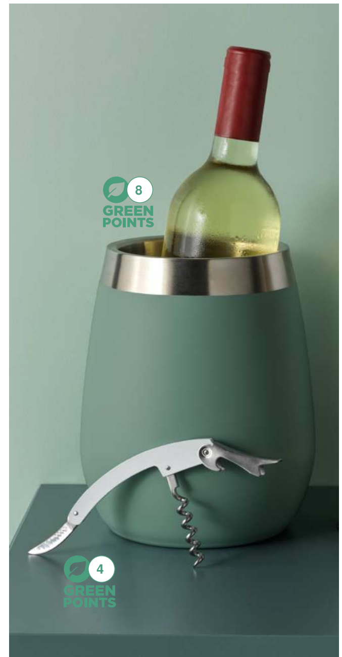
113209 | ENFRIADOR DE VINO "TROMSO" | Acero inoxidable | Ø 11.9 x 19 cm | 3.961 kg CO 2 e