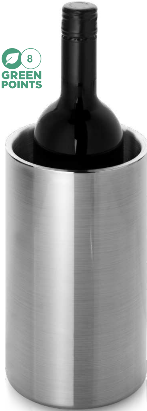
112275 | ENFRIADOR DE VINO DE ACERO INOXIDABLE Y CON DOBLE PARED "CIELO" | Acero inoxidable | Ø 12 x 18 cm | 4.644 kg CO 2 e