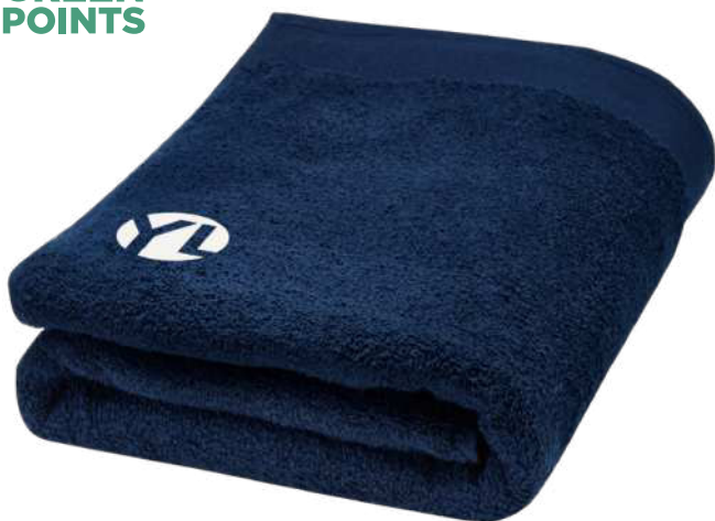
117006 | TOALLA DE 70 X 140 CM DE ALGODÓN DE 550 G/M 2 "ELLIE" | Algodón | 140 x 70 cm | 4.711 kg CO 2 e ●●●