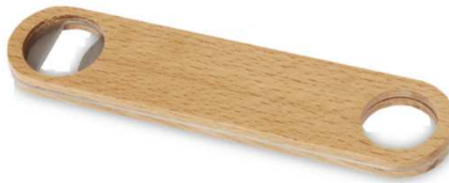
113204 | ABREBOTELLAS DE MADERA "ORIGINA" | Madera | 17.7 x 3.9 x 0.9 cm | 0.386 kg CO 2 e