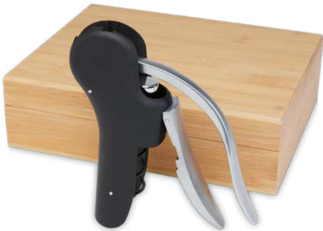
113250 | SACACORCHOS PARA VINO "NEBBY" | Madera de bambú | 23.5 x 18.5 x 6.8 cm | 3.387 kg CO 2 e