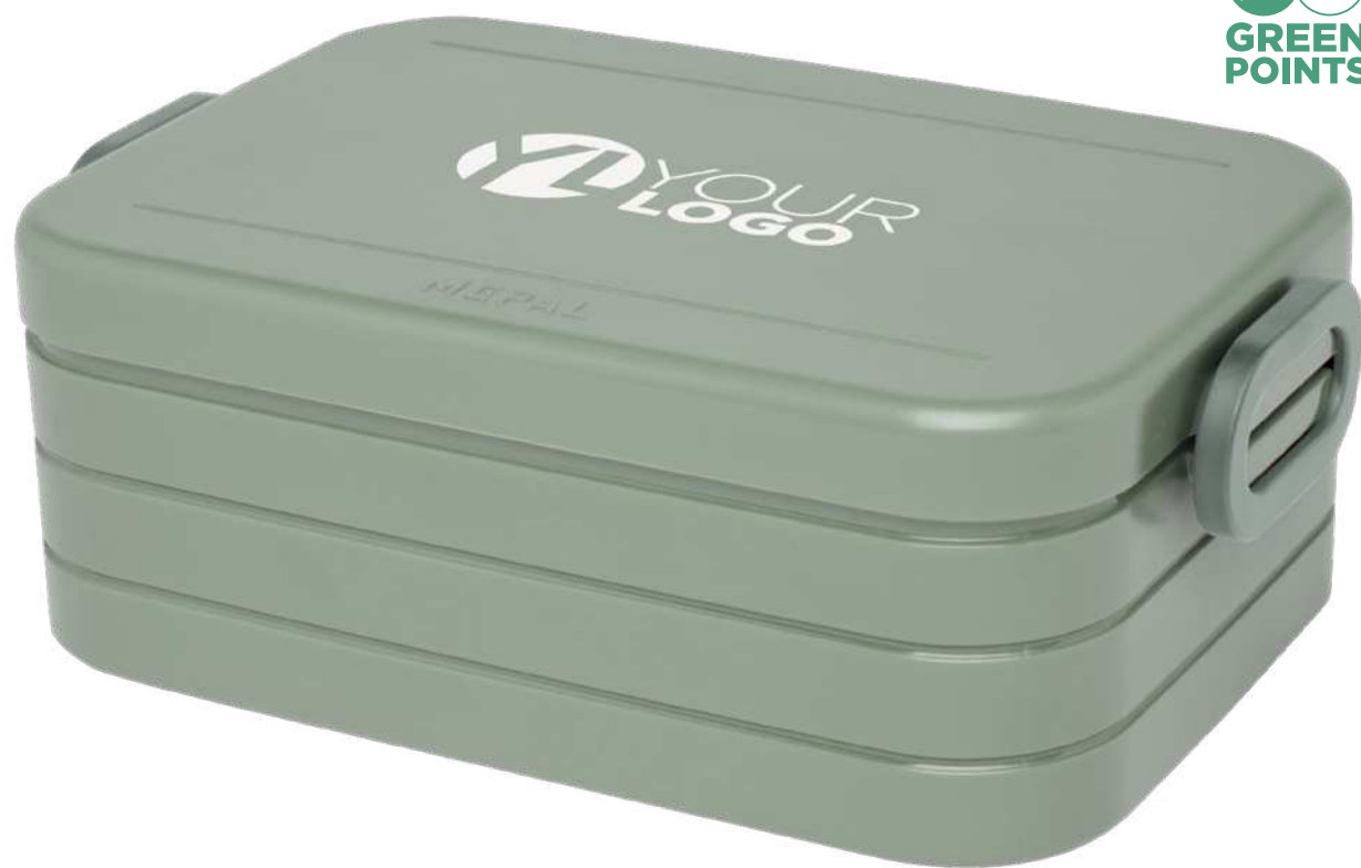
113135 | MEPAL FIAMBRERA MEDIANA "TAKE-A-BREAK" | Plástico ABS | 19 x 12 x 7 cm | 1.092 kg CO 2 e ○●●●