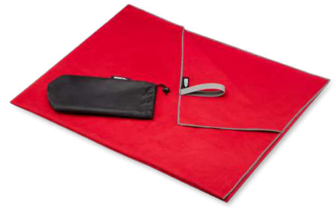
113324 | TOALLA ULTRALIGERA Y DE SECADO RÁPIDO GRS DE 100 x 180 CM "PIETER" | Poliéster reciclado - Nylon | 180 x 100 cm | 0.293751 kg CO 2 e ●●●●