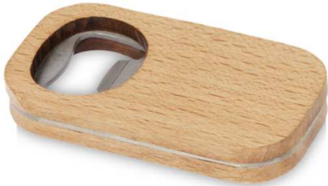
113202 | ABREBOTELLAS "BOEMIA" | Madera | 3.8 x 7 x 1 cm | 0.139 kg CO 2 e