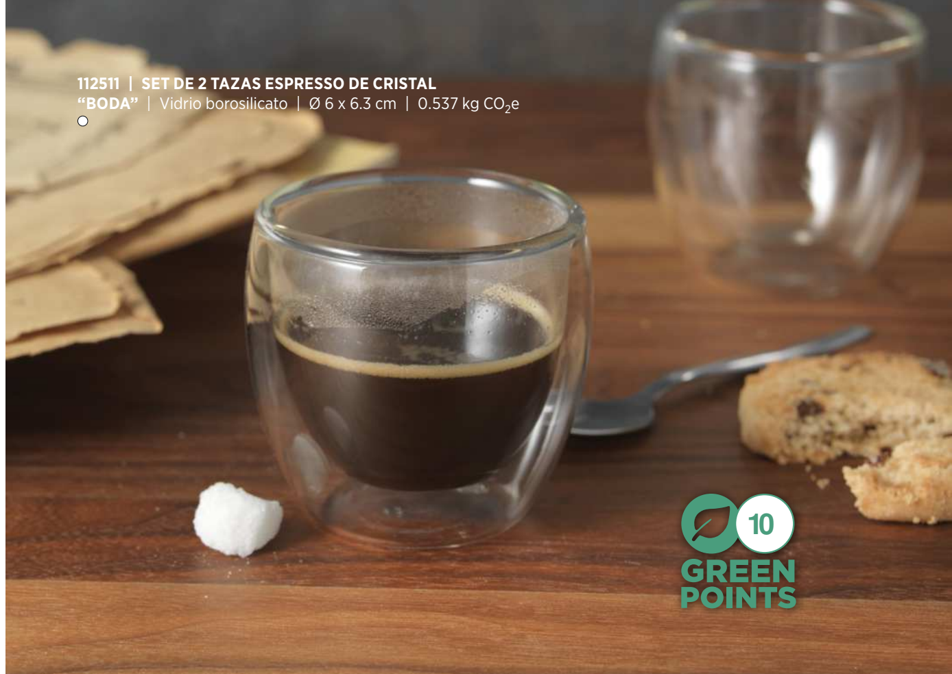
112511 | SET DE 2 TAZAS ESPRESSO DE CRISTAL "BODA" | Vidrio borosilicato | Ø 6 x 6.3 cm | 0.537 kg CO 2 e