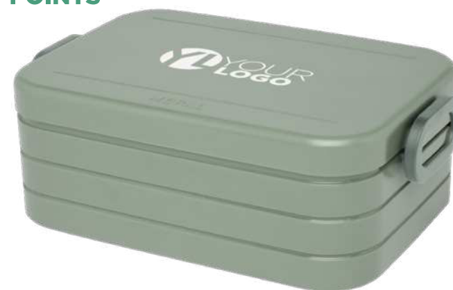
113135 | MEPAL FIAMBRERA PER PRANZO TAKE-A-BREAK | 19 x 12 x 7 cm | 1.092 kg CO 2 e