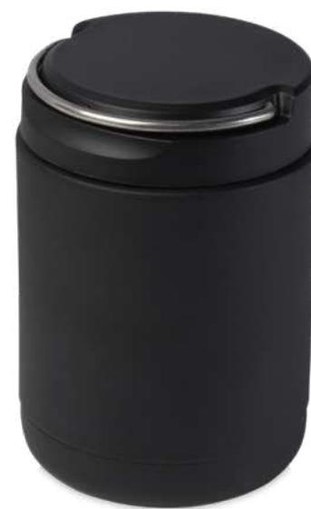
113340 | FIAMBRERA IN ACCIAIO INOXIDABILE RICICLATA 100% | 100% Recycled stainless steel | Ø 9.9 x 14.3 cm | 1.47 kg CO 2 e