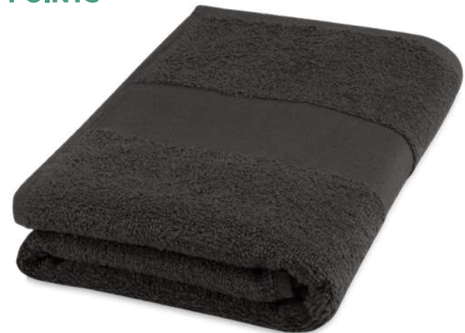
117001 | TOALLA DE 50 X 100 CM DE ALGODÓN DE 450 G/M 2 "CHARLOTTE" | Algodón | 100 x 50 cm | 1.966 kg CO 2 e ●●●●●