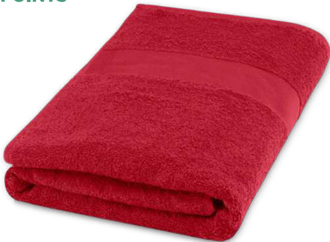
117002 | TOALLA DE 70 X 140 CM DE ALGODÓN DE 450 G/M 2 "AMELIA" | Algodón | 140 x 70 cm | 3.854 kg CO 2 e ●●●●●