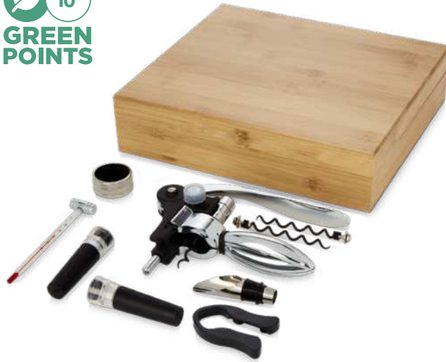
113145 | JUEGO DE VINO DE NUEVE PIEZAS "MALBICK" | Acero inoxidable | 28 x 25 x 7 cm | 5.346 kg CO 2 e