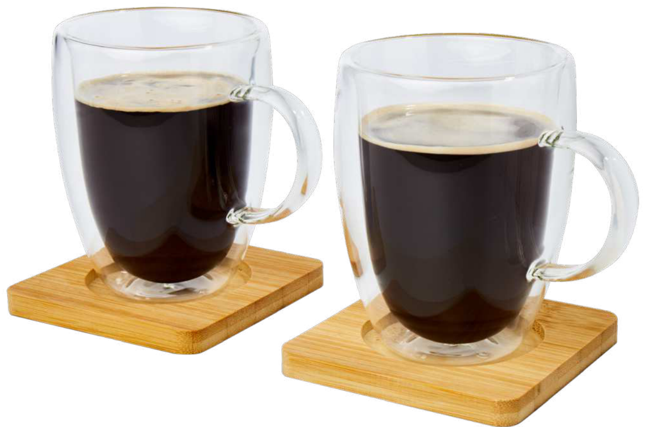
113316 | DOS TAZAS DE VIDRIO DE DOBLE PARED DE 350 ML CON POSAVASOS DE BAMBÚ "MANTI" | Vidrio borosilicato | Ø 8.5 x 12 x 11.2 cm | 1.037 kg CO 2 e