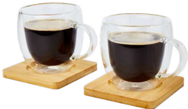
113315 | DOS TAZAS DE VIDRIO DE DOBLE PARED DE 250 ML CON POSAVASOS DE BAMBÚ "MANTI" | Vidrio borosilicato | Ø 9 x 12 x 9 cm | 0.9 kg CO 2 e