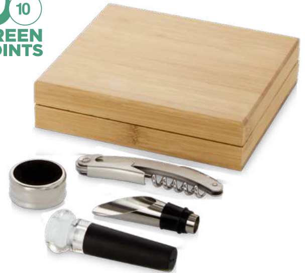
113147 | JUEGO DE VINO DE CUATRO PIEZAS "SYRAT" | Acero inoxidable | 15 x 16 x 4 cm | 1.635 kg CO 2 e