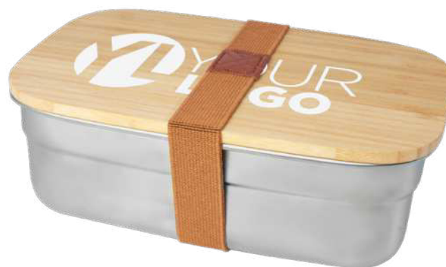
113275 | FIAMBRERA IN ACCIAIO INOXIDABILE CON SAPADEBAMBÙ E FERRICHIOMBAMBÙ | Legno di bambù | 18 x 12 x 6 cm | 1.166 kg CO 2 e