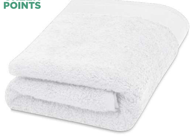
117005 | TOALLA DE 50 X 100 CM DE ALGODÓN DE 550 G/M 2 "NORA" | Algodón | 100 x 50 cm | 2.403 kg CO 2 e ●●●