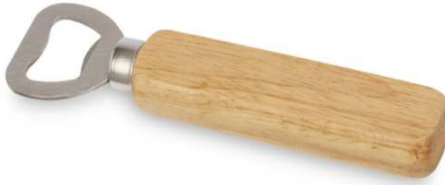
113203 | ABREBOTELLAS DE MADERA "BRAMA" | Madera | 13.9 x 3.9 x 1.7 cm | 1.851 kg CO 2 e