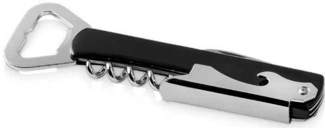
112599 | ABRIDOR DE CAMARERO "MILO" | Plástico ABS | 13.5 x 4 x 1.3 cm | 0.445 kg CO 2 e