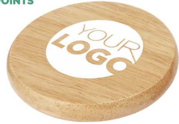
113201 | POSAVASOS DE MADERA CON ABREBOTELLAS "SCOLL" | Madera | Ø 6.7 cm | 0.108 kg CO 2 e