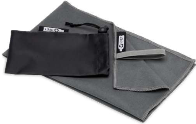
113322 | TOALLA ULTRALIGERA Y DE SECADO RÁPIDO GRS DE 30 x 50 CM "PIETER" | Poliéster reciclado - Nylon | 50 x 30 cm | 0.117501 kg CO 2 e ●●●●