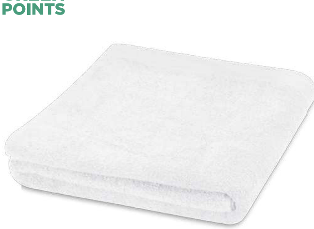
117007 | TOALLA DE 550 G/M 2 DE ALGODÓN DE 100 X 180 CM "RILEY" | Algodón | 180 x 100 cm | 8.652 kg CO 2 e ●●●