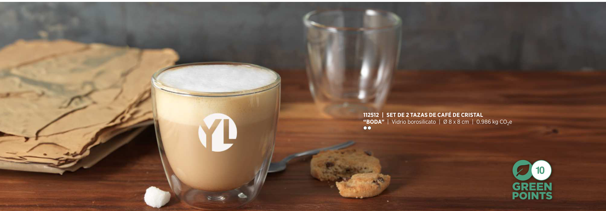
112512 | SET DE 2 TAZAS DE CAFÉ DE CRISTAL "BODA" | Vidrio borosilicato | Ø 8 x 8 cm | 0.986 kg CO 2 e