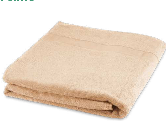
117003 | TOALLA DE 100 X 180 CM DE ALGODÓN DE 450 G/M 2 "EVELYN" | Algodón | 180 x 100 cm | 7.079 kg CO 2 e ●●●●●