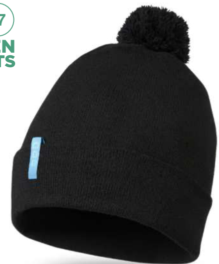
37531 | GORRO BEANIE RECICLADO GRS "OLIVINE" | Poliéster reciclado con certificado GRS - Nylon - Elastano | 29 x 23.5 cm | 0.058 kg CO 2 e