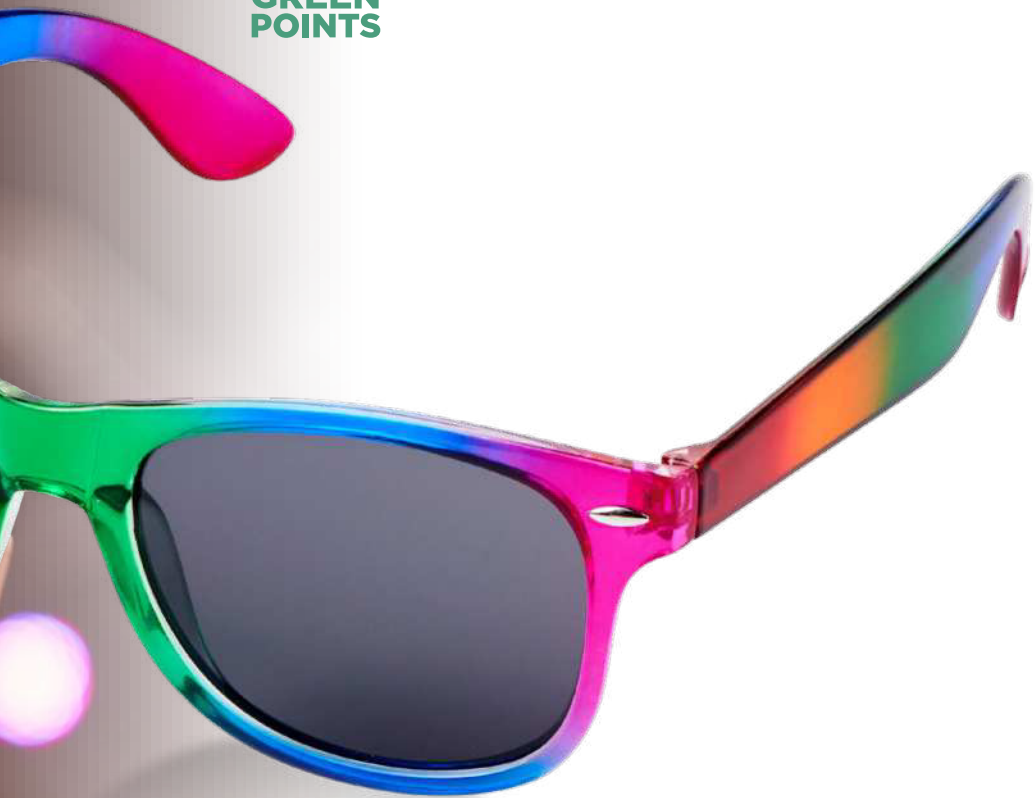
101004 | GAFAS DE SOL ARCOÍRIS "SUN RAY" | Plástico PC | 16 x 15 x 5 cm | 0.125 kg CO 2 e