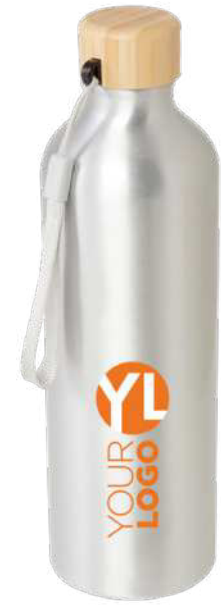
100795 | BIDÓN DE ALUMINIO RECICLADO DE 770 ML CON CERTIFICACIÓN RCS "MALPEZA" | Recycled Aluminium | Ø 3.6 x 7.3 x 24.4 x 7.3 cm | 0.427094 kg CO 2 e