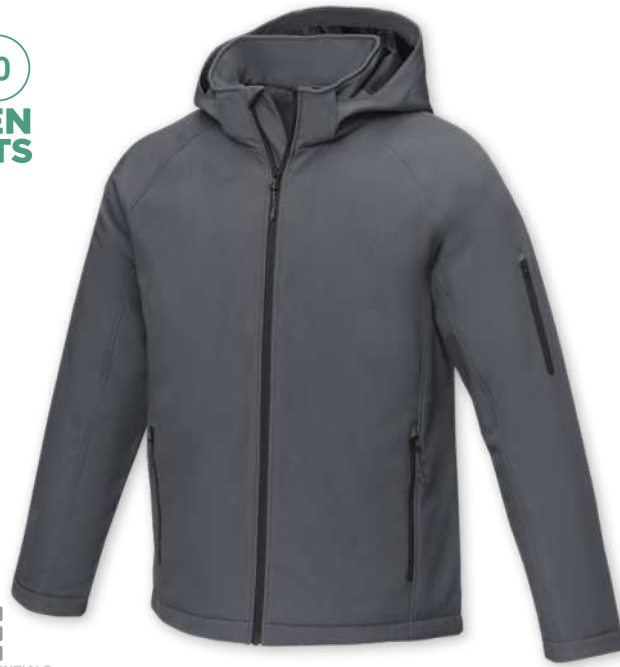
38338 | CHAQUETA SOFTSHELL ACOLCHADA PARA HOMBRE "NOTUS" | Poliéster | 4.6 kg CO 2 e