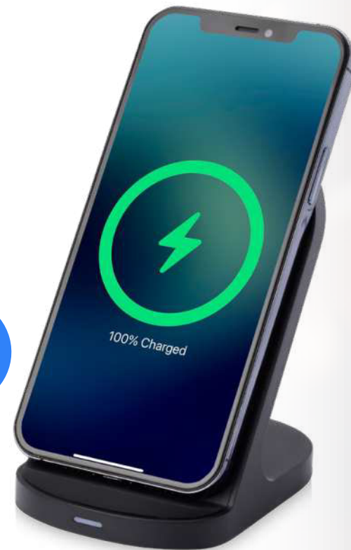
124340 | BASE DE CARGA INALÁMBRICA CON DOBLE BOBINA DE 15W EN PLÁSTICO RECICLADO CON CERTIFICACIÓN RCS "LOOP" | Plástico ABS reciclado | 7 x 9.6 x 10.4 cm | 2.6 kg CO 2 e