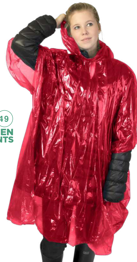
109417 | PONCHO DE LLUVIA DESECHABLE DE MATERIAL RECICLADO CON BOLSA DE ALMACENAMIENTO "MAYAN" | Plástico reciclado | 10 x 15 x 0.5 cm | 0.47 kg CO 2 e