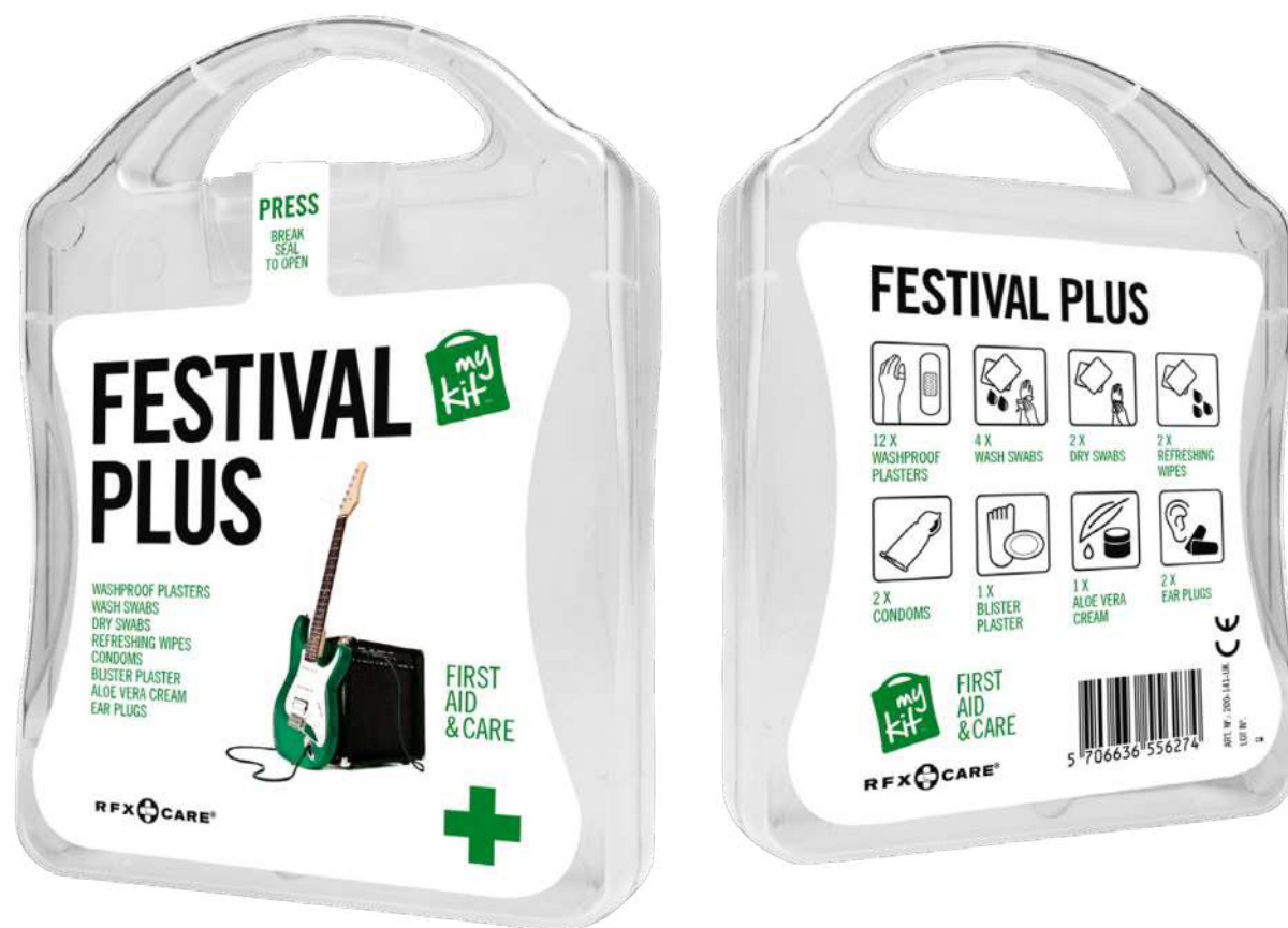
122527 | MYKIT FESTIVAL PLUS | Plástico | 10 x 3 x 13.4 cm | 0.407 kg CO 2 e