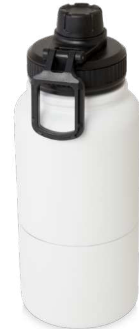
100787 | BIDÓN DEPORTIVO CON AISLAMIENTO DE ACERO INOXIDABLE DE 840 ML CON CERTIFICACIÓN RCS "DUPECA" | Recycled stainless steel | Ø 5.25 x 9.6 x 23.15 x 9.6 cm | 1.453894 kg CO 2 e