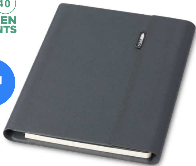
107868 | ORGANIZADOR "LIBERTO" | Papel reciclado | 23 x 17.5 x 2.5 cm | 0.741 kg CO 2 e