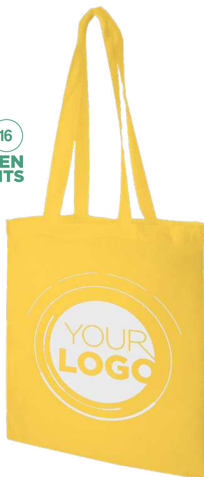
120181 | BOLSA TOTE DE ALGODÓN 140 G/M 2 "MADRAS" | Algodón | 38 x 42 cm | 0.579 kg CO 2 e