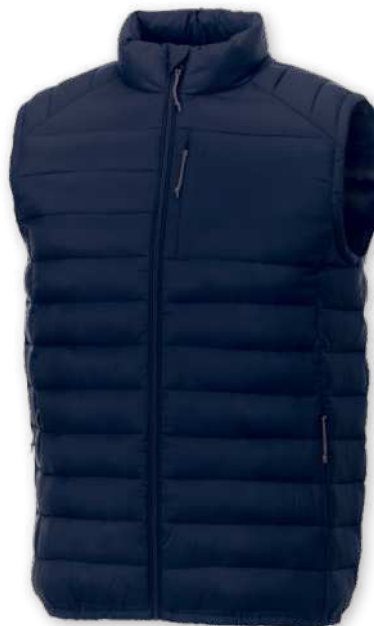
39433 | CHALECO CON AISLAMIENTO PARA HOMBRE "PALLAS" | Nylon | 6.829 kg CO 2 e